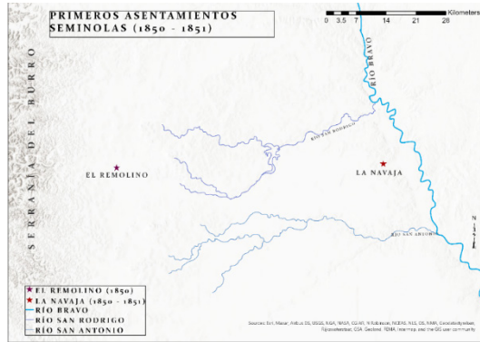
Figura 1. Primeros asentamientos seminolas, 1850–1851