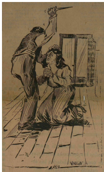
Figura 2. Caricatura de un hombre intentando apuñalar a una mujer