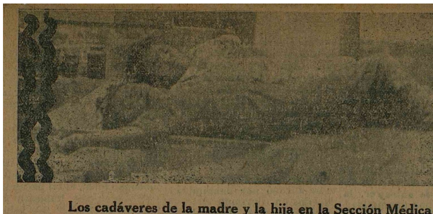
Figura 5. Fotografía de los cadáveres de madre e hija en la sección Médica Municipal